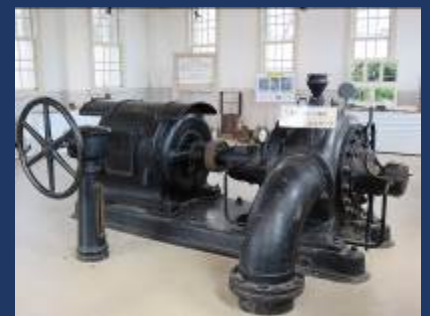
創設当時の送水ポンプ